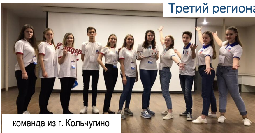
команда из г. Кольчугино

21 ноября во Владимирском институте развития образования имени Л.И. Новиковой прошёл третий слёт Владимирского регионального отделения